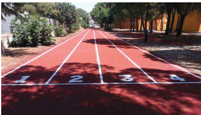
Rifacimento della pista di atletica nella scuola di via Argentina.