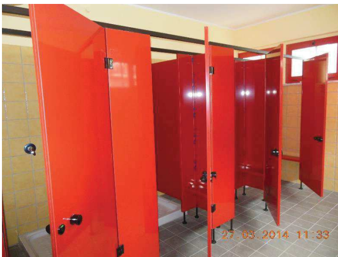
Rifacimento dei servizi igienici a servizio della palestra.